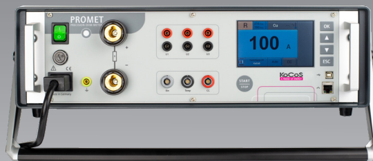
PROMET R300 / R600